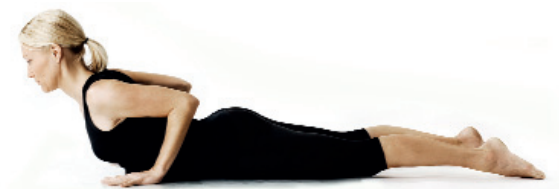
12. Kobran/ Bhujangasana