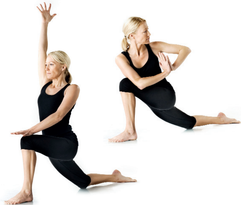
17. Roterad sidställning/ Parivritta Parsvakonasana