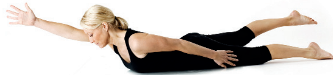
13. Gräshoppan/ Shalabhasana