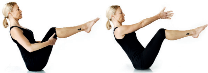
21. Båten/ Navasana