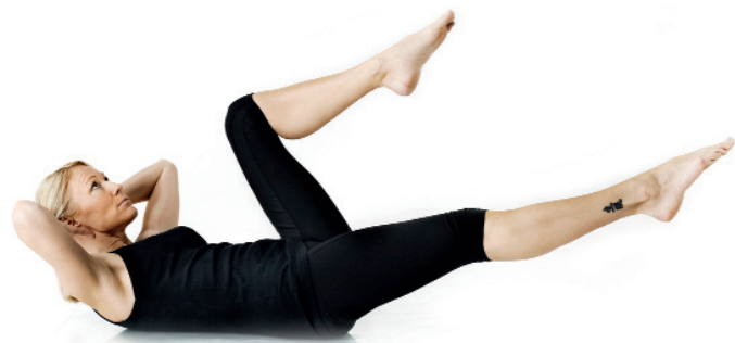
22. Utsträckt båt/ Naukasana