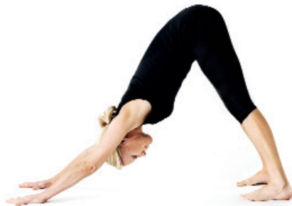
7. Bergstoppsställningen / Parvatasana (kallas även för Hunden)