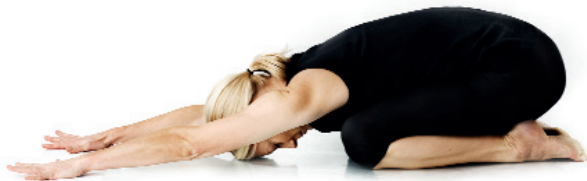
16. Barnets position/ Balasana