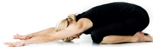
4. Barnets position/ Balasana