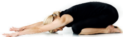
2b. ALTERNATIV TILL ANDNINGSTÄLLNING Barnets position/ Balasana