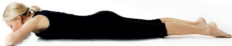
15. Ligga på mage/ Advasana