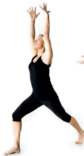
10. Halvmåneställningen / Ardha Chandrasana