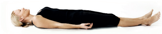
31. Dödmansställning/ Savasana