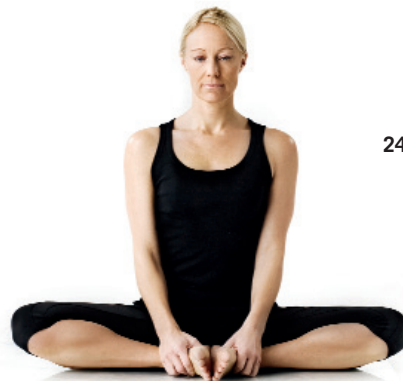
24. Fjärilen/ Baddha Konasana